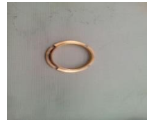
Figura 2 Tuerca Asiento