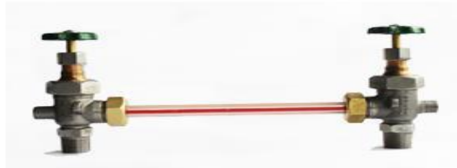
FIGURA 7 Ensamble del Juego de Nivel después de haber cambiado el asiento.