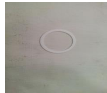
Figura 4 Empaque