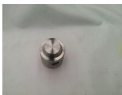
Figura 5 Disco Canasta