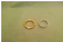
Figura 3 Para Ensamble Asiento