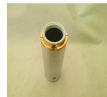
Figura 6 Llave para colocar Asiento