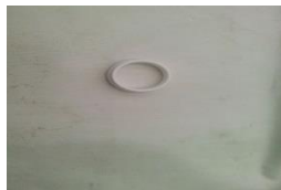
Figura 1 Asiento

Si la válvula o el check presentan fugas en el asiento por temperatura se debe cerciorar que esté operando dentro de los rangos de temperatura establecidos para su funcionalidad.